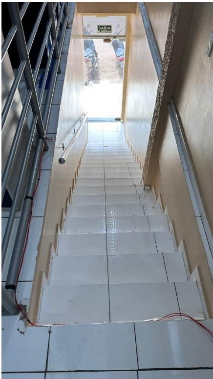
FOTO 02 - ESCADA